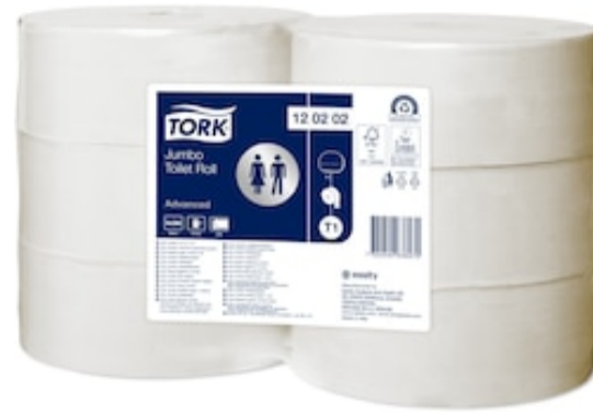
Tork T1 Adv Soft C. ig. Jumbo 280 mt 120202